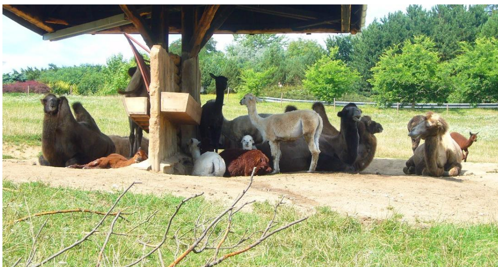
Obrázek 3: Společný výběh velbloudů a alpak v Zoo Ústí nad Labem